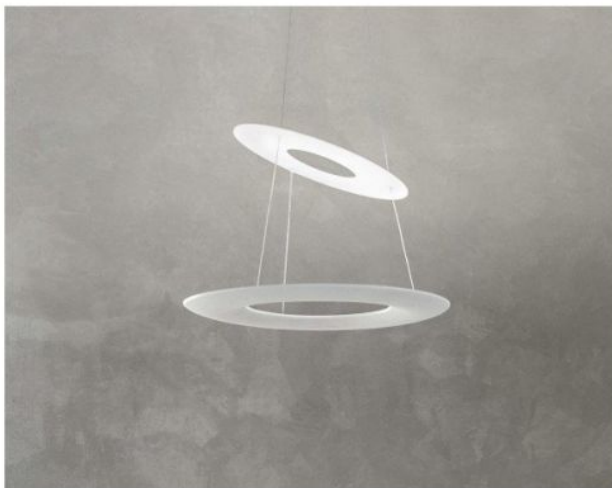
Available Versions Erhältliche Ausführungen