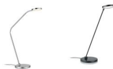
THEA-T-Flex und THEA-T 61.623.xx und 61.626.xx Tischleuchte / table lamp 10,8 W LED, 2.700 K, 1100 lm