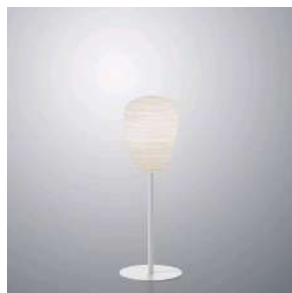
Rituals 1 Mix&Match