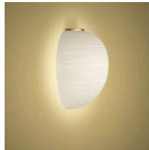
Rituals XL Mix&Match