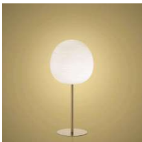
Rituals XL Mix&Match