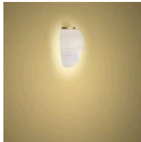
Rituals 3 Parete