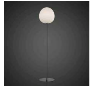
Rituals XL Mix&Match