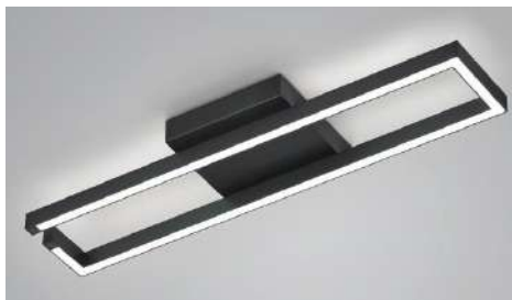
91.365.xx 46 W, 5.304 lm, 2.700 K EEL-F