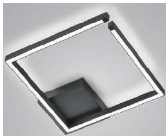
91.364.xx 46 W LED, 5.321 lm, 2.700 K EEL-F