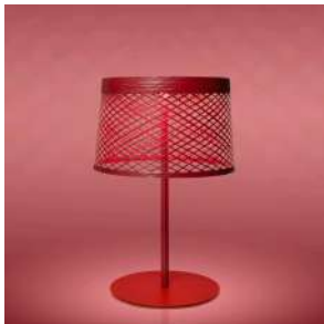
Twiggy Grid XL