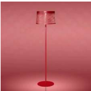
Twiggy Grid Lettura