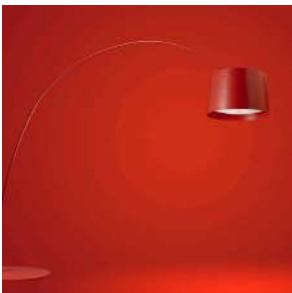
Twice as Twiggy