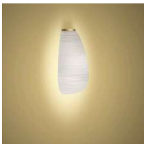
Rituals 1 Mix&Match