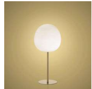
Rituals XL Mix&Match