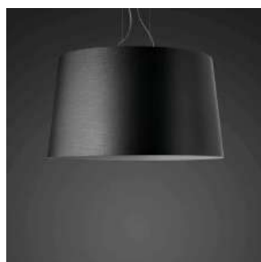
Twice as Twiggy