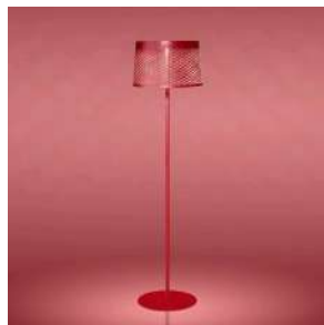
Twiggy Grid Lettura