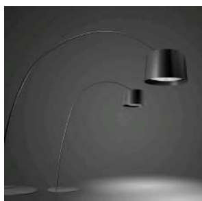
Twice as Twiggy