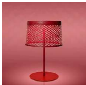
Twiggy Grid XL