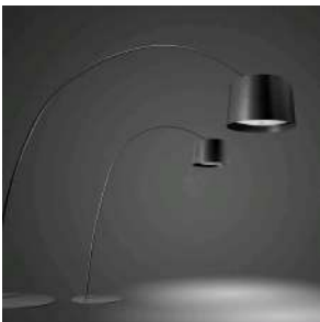
Twice as Twiggy