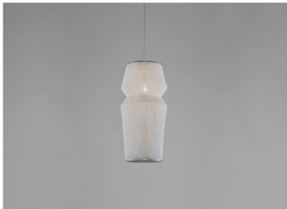
Available Versions Erhältliche Ausführungen