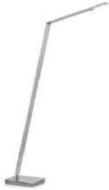
JULI-S 41.968.xx Stehleuchte / floor lamp 10,8 W LED, 2.700 K, 1200 lm