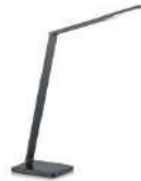
JULI-T 61.622.xx Tischleuchte / table lamp 10,8 W LED, 2.700 K, 1200 lm